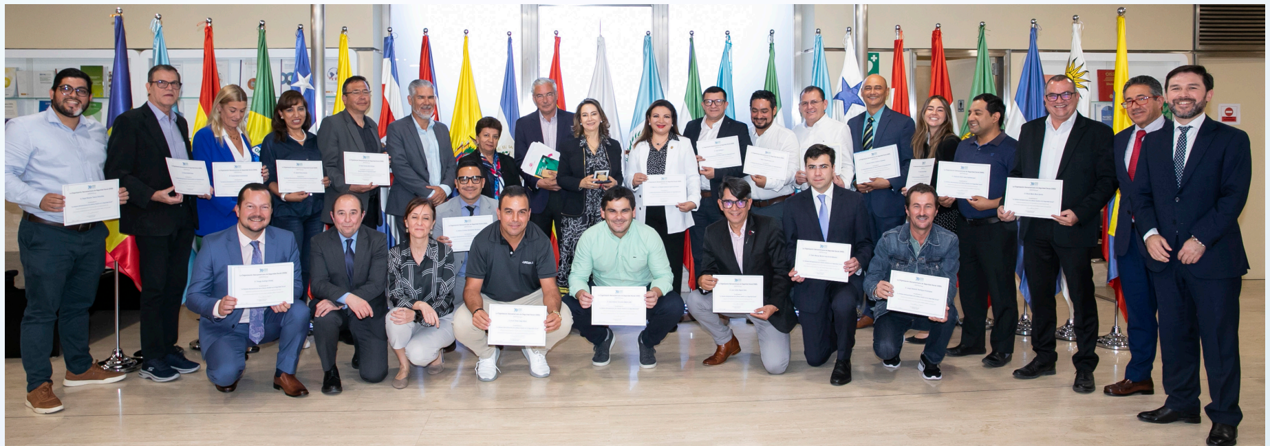
Foto de grupo de la Semana Iberoamericana de la Buena Gestión en la Seguridad Social – 2024