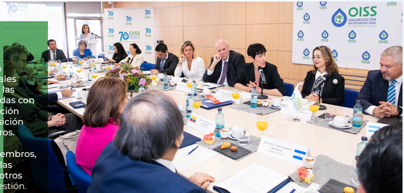
Foto de un desayuno informativo del Convenio Multilateral Iberoamericano de Seguridad Social, invitado el Cuerpo Diplomático de los países iberoamericanos acreditado en España, la ministra de Inclusión, Seguridad Social y Migraciones y el canciller de Honduras (2024)