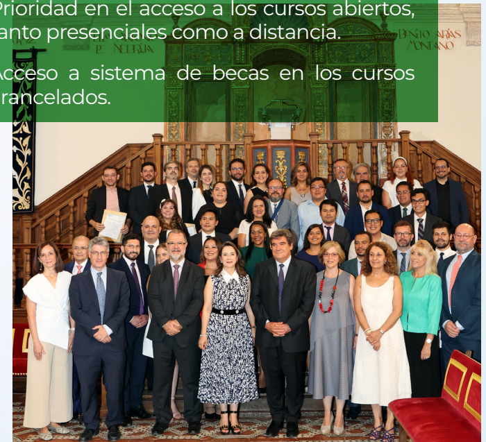
Foto de grupo de la edición del XXV aniversario del Máster en Dirección y Gestión de los Sistemas de Seguridad Social