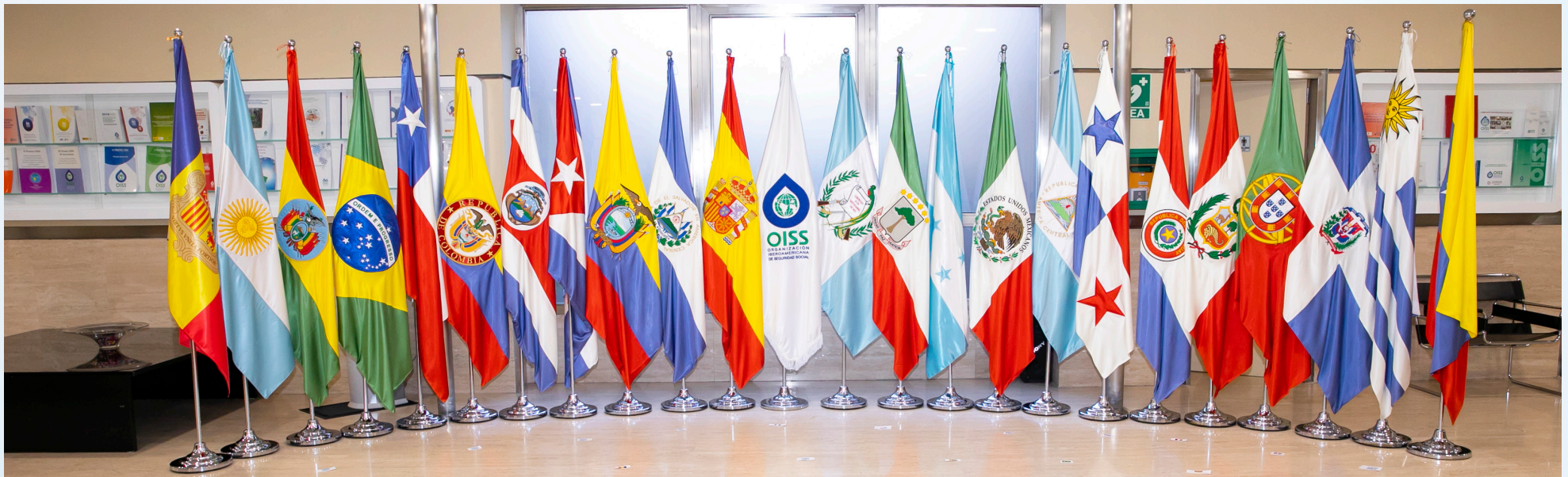
Foto de las banderas de los países que hacen parte de la OISS