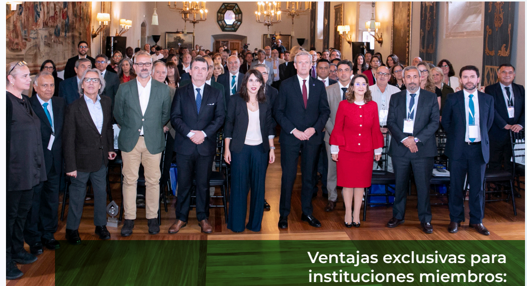
Foto de grupo del XIII Congreso Iberoamericano PREVENIA 2023

Participa en los espacios de estudio, análisis, debate y conocimiento de las comisiones técnicas permanentes de: planes y fondos de pensiones, prestaciones económicas y pensiones, órganos de inspección vigilancia y control, riesgos profesionales y la de servicios sociales.