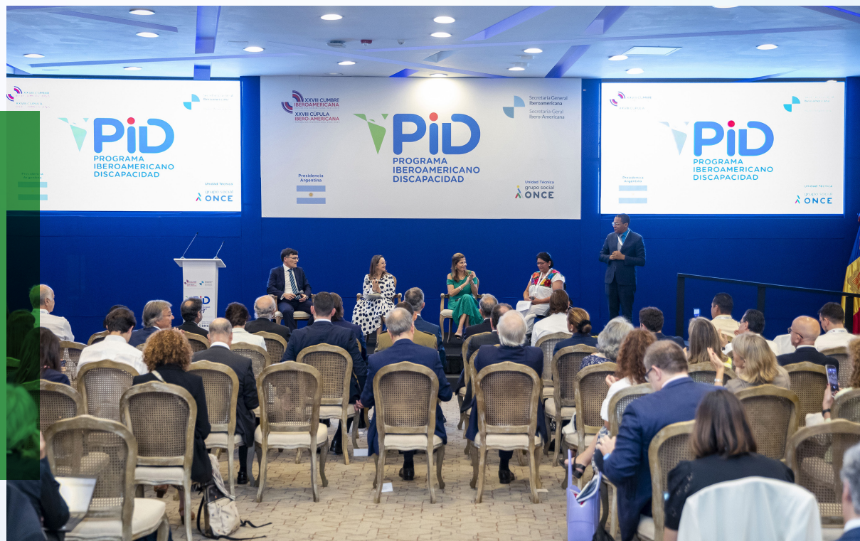
Foto durante la presentación de los logros del Programa Iberoamericano de Discapacidad (PID) - marzo de 2023