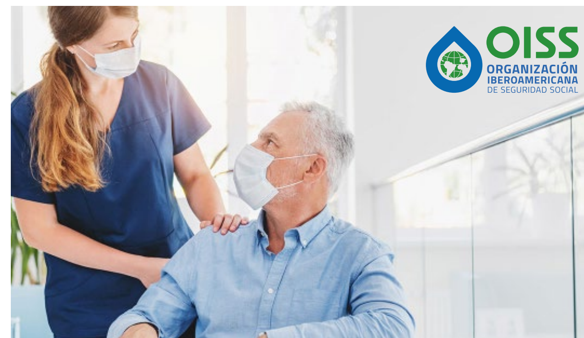
El logotipo puede apreciarse de manera correcta, la posición esta seleccionada en el punto máximo de claridad.