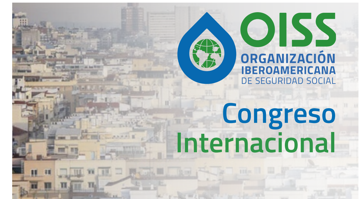
El logotipo puede apreciarse de manera correcta, la posición está seleccionada en el punto máximo de claridad.