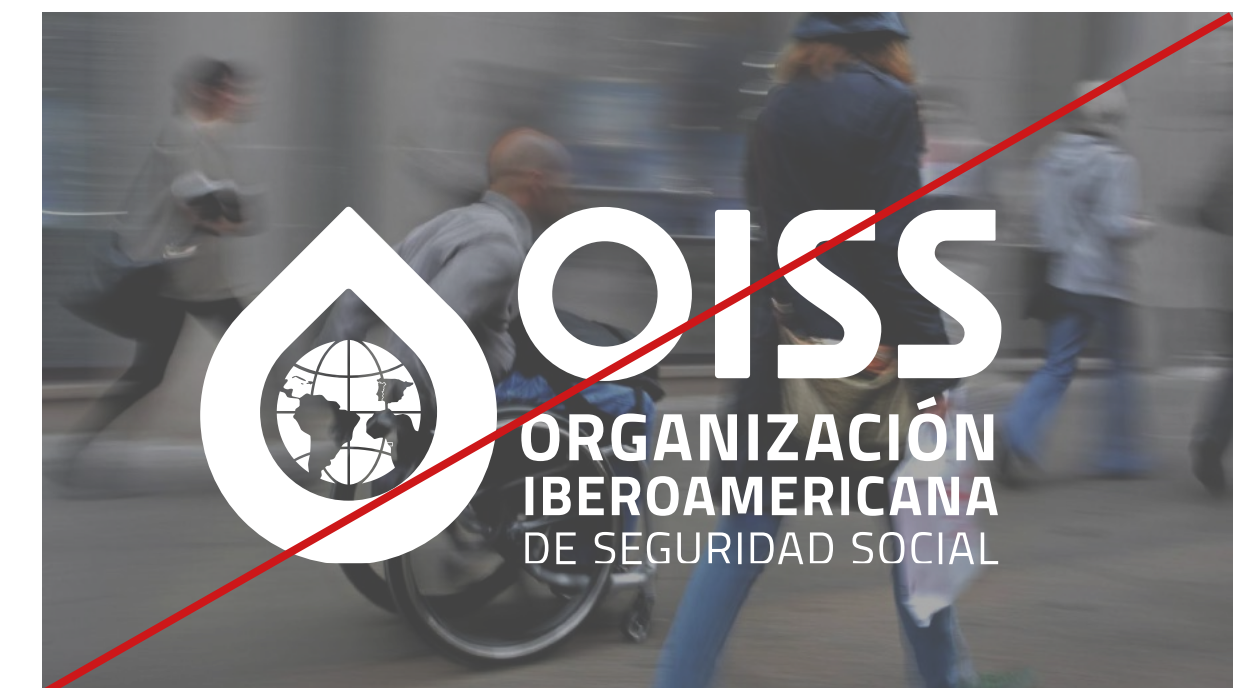
logotipo sobre fotografía sin tratar, de menos de 40% de oscuridad