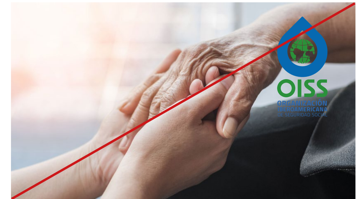
La posición del logotipo afecta a la visibilidad.