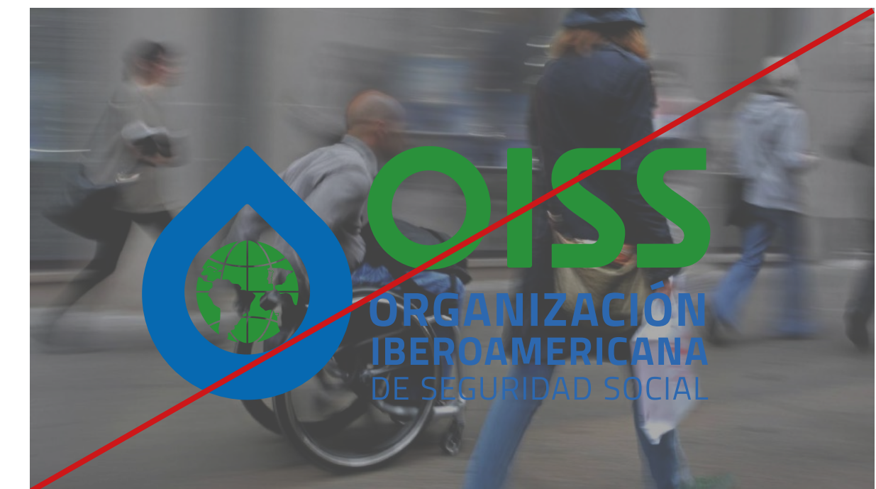
logotipo sobre fotografía sin tratar, con menos de 40% de claridad