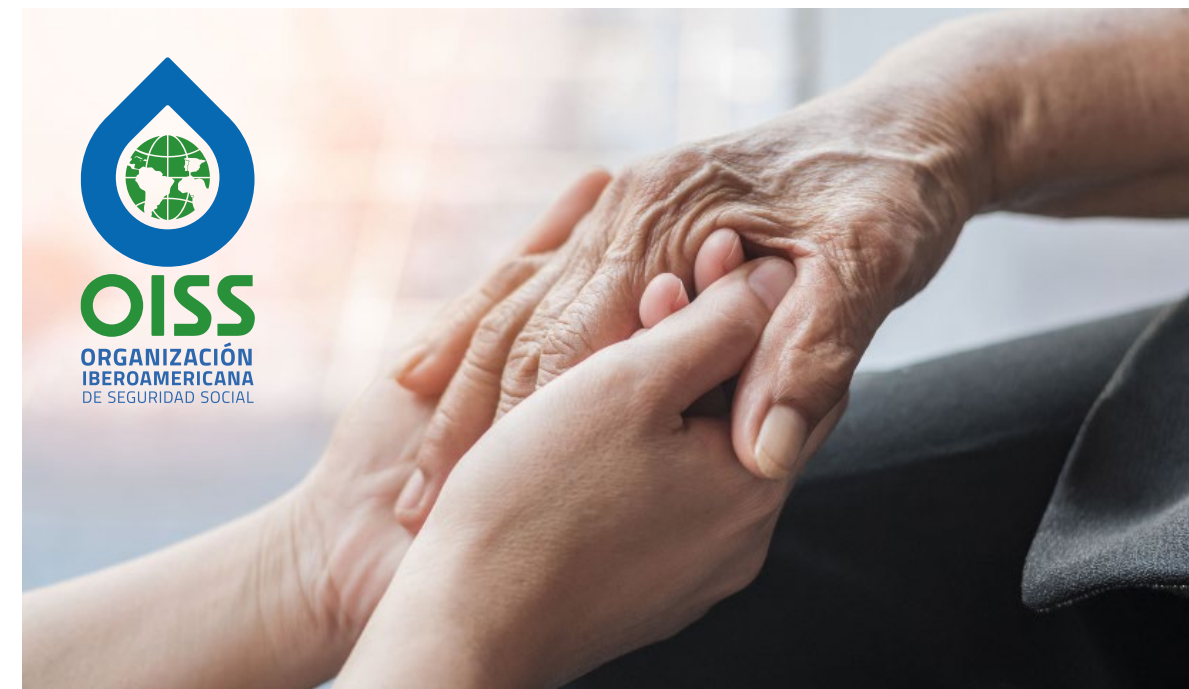
El logotipo puede apreciarse de manera correcta, la posición esta seleccionada en el punto máximo de claridad.

Si las fotografías o gráficos no se pudieran tratar, el logotipo ha de colocarse en el lugar más adecuado, respetando las directrices anteriores, siempre si es posible se seleccionará el recurso visual con antelación, teniendo en cuenta la visibilidad total, sobre negro o blanco preferentemente.