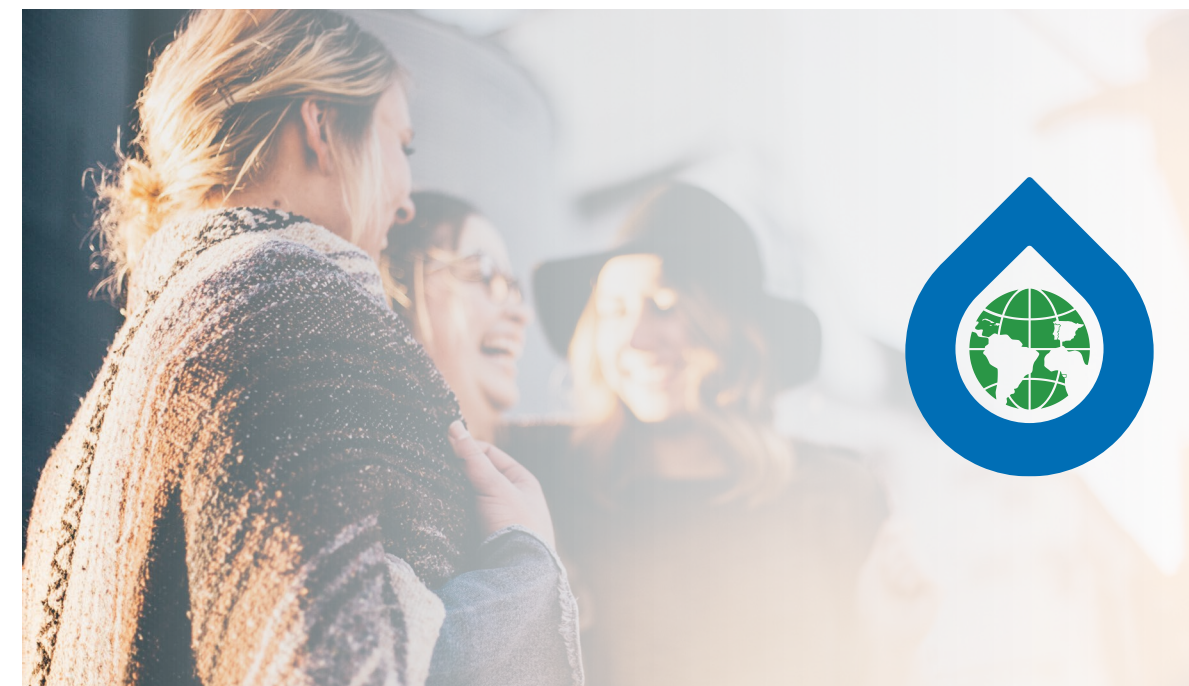
El logotipo puede apreciarse de manera correcta, la posición está seleccionada en el punto máximo de claridad.