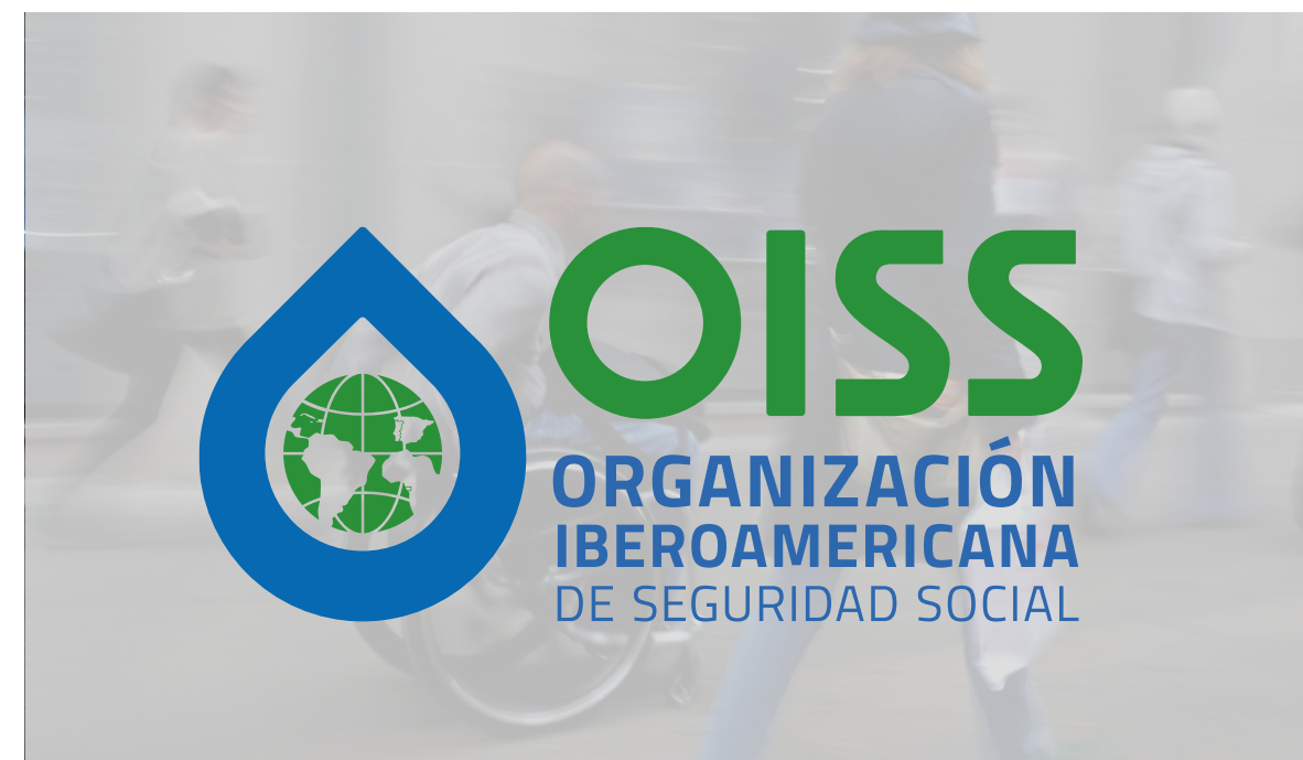
logotipo sobre plano de más de 40% claridad

Criterio inclusivo en el uso de las imágenes debe de favorecer el contraste, debe procurarse que el fondo no tenga imágenes o diseños que impidan este efecto.