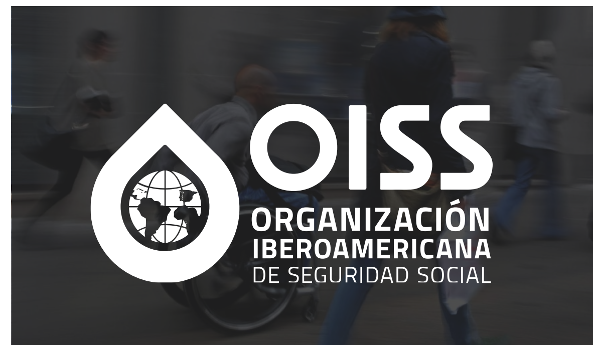
logotipo sobre plano de más de 40% de oscuridad