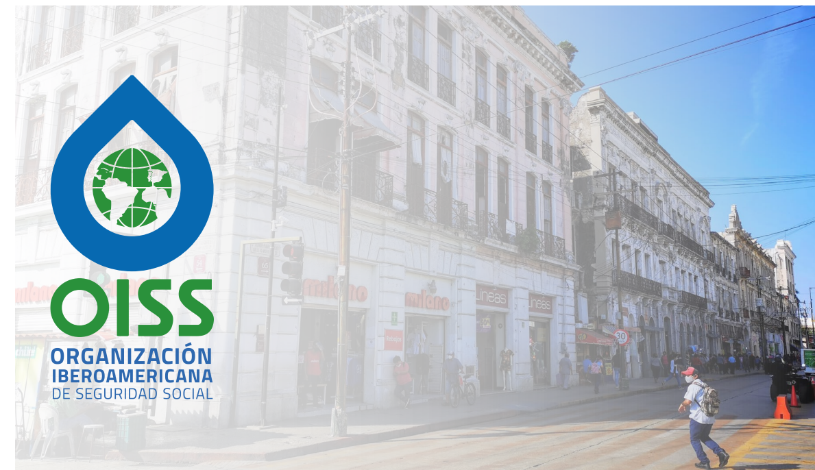
El logotipo puede apreciarse de manera correcta, la posición esta seleccionada en el punto máximo de claridad.

Si fuera necesario, se aplicará un degradado para conseguir una visibilidad óptima del logotipo, siempre usando las referencias corporativas a degradados.