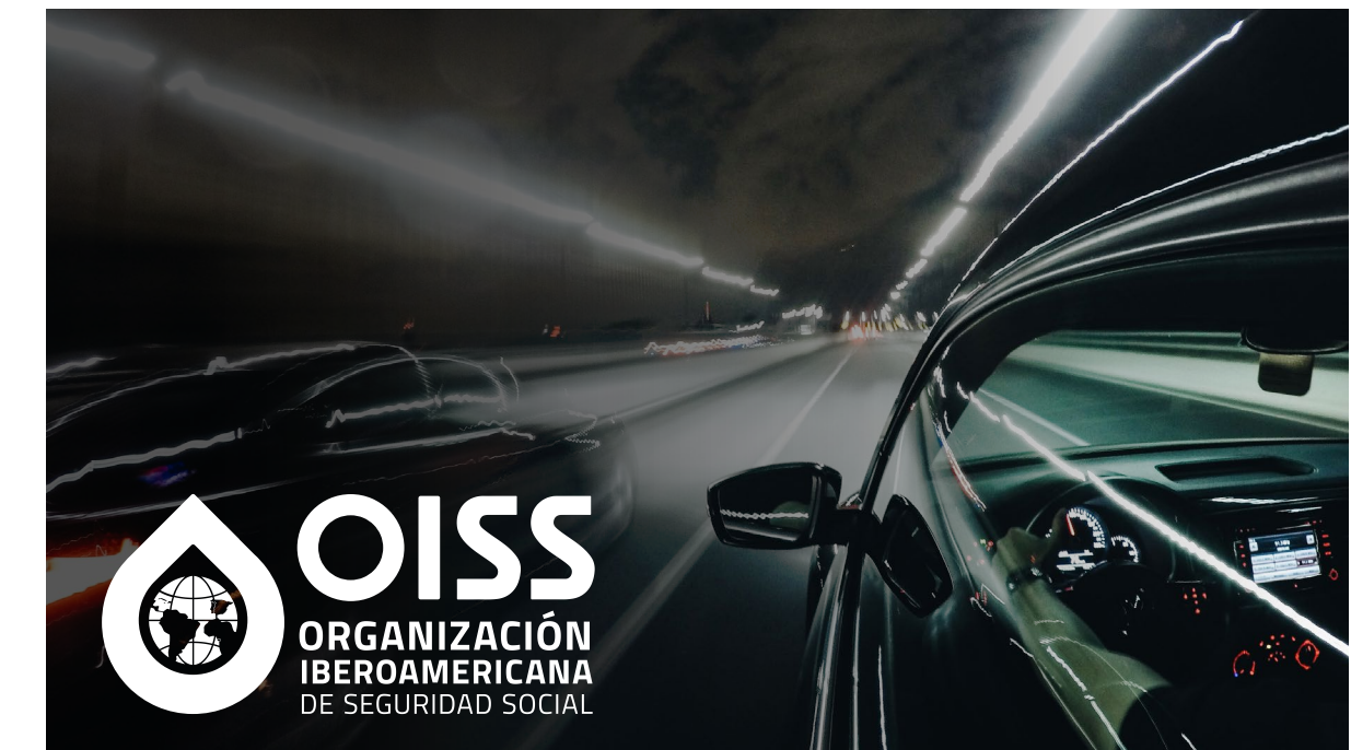
El logotipo puede apreciarse de manera correcta, la posición esta seleccionada en el punto de mayor contraste. <!--