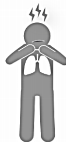
Dificultad para respirar