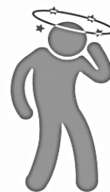
Dolor de cabeza y de garganta