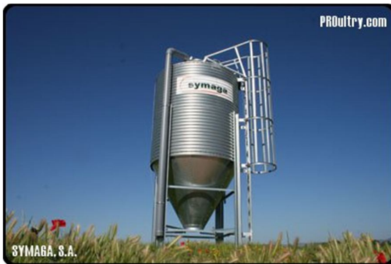
SILO CON ESCALERA LATERAL DE SERVICIO

Un trabajador recientemente incorporado a la empresa (9 días), subía por la escalera vertical de un silo, la cual no disponía de resguardo de seguridad ni dispositivos anti caídas. Durante su ascenso, este pierde el equilibrio y cae desde una altura aproximada de 8 metros, produciéndose el fallecimiento posterior del trabajador.