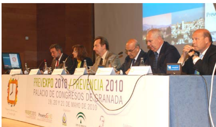
Acto inaugural de Prevexpo/Prevencia 2010

Entre los días 19 y 21 de mayo, la ciudad andaluza de Granada (España) ha acogido Prevexpo/Prevencia 2010, celebración conjunta de la cuarta edición del Congreso de Prevención de Riesgos Laborales en Iberoamérica, PREVENCIA , y de la décima de PREVEXPO, Congreso Andaluz de Seguridad y Salud laboral .