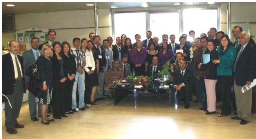
Clausura del Seminario OISS-CEDDET 2010 el pasado día 18 de junio en la Sede de la OISS en Madrid (España)

El objetivo del Seminario es reforzar los conocimientos y habilidades adquiridos en el curso online. Durante el seminario se han celebrado conferencias, se han realizado diversas visitas a instituciones de interés como