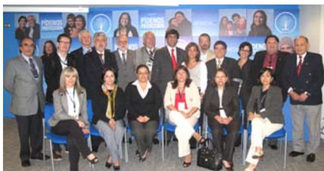
Asistentes de los distintos países al Congreso

Se desarrolló en Santiago, los días 16 y 17 de Noviembre del 2009 el Congreso de Órganos Reguladores y de Control de Sistemas de Salud. El evento contó con los auspicios de la OISS, la OPS, la Superintendencia de Salud del Paraguay y del Instituto de Políticas Públicas a la Universidad Andrés Bello. Asistieron al encuentro representantes de Uruguay, Perú, Ecuador, Colombia, Argentina, Paraguay, República Dominicana, Brasil, México y Chile. Tuvo como objetivo abordar los desafíos futuros en el ámbito regulatorio y de esta manera entregar una mayor protección social a los ciudadanos.