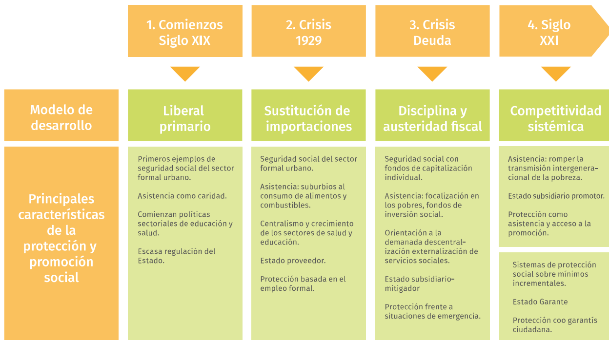
Figura 1. Protección social, un concepto en evolución