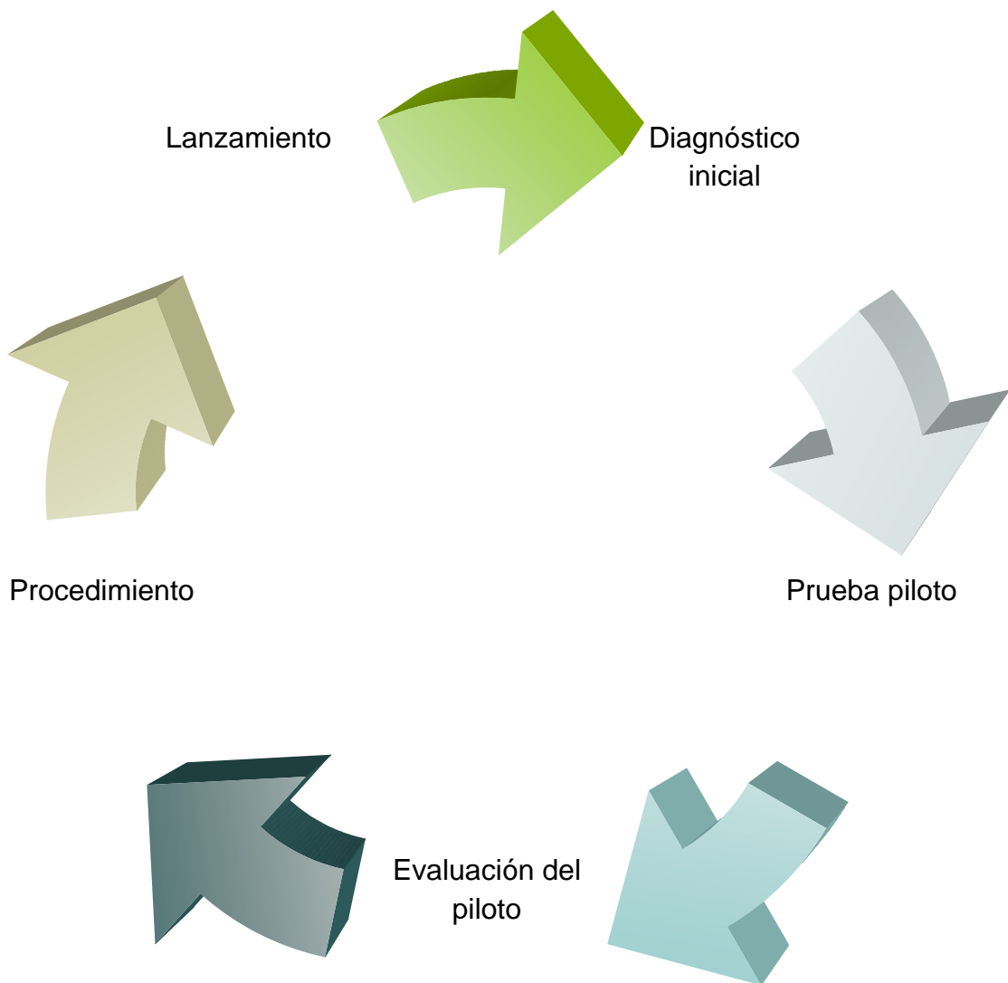
Figura 1: Procedimiento de implantación del teletrabajo

En el anexo 1 se aporta una lista de chequeo para realizar el diagnóstico inicial de la empresa.