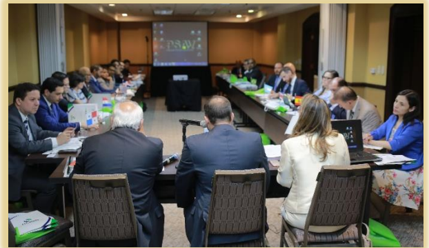
Desarrollo de la primera reunión con todos los representantes de los países de Iberoamérica.

El día 28 de noviembre del 2018, en Santo Domingo, República Dominicana, se celebraron las sesiones ordinarias de la Comisión Económica y del Comité Permanente de la Organización Iberoamericana de Seguridad Social (OISS), en las que participaron los representantes gubernamentales de los países afiliados al Organismo.