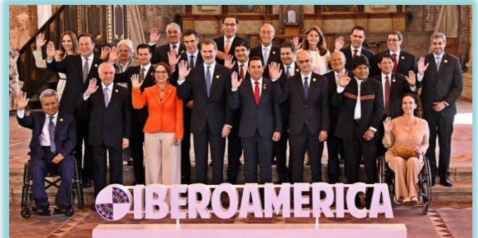
Foto familia, Cumbre Iberoamericana de Jefes de Estado y de Gobierno.