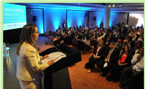
Palabras a cargo de secretaria general de la OISS, Gina Magnolia Riaño Barón.

Es un reconocimiento que se otorga visitantes extranjeros que se hayan destacado en la Cultura, las Ciencias, la Política, el Deporte, o hayan prestado relevantes servicios a la humanidad.