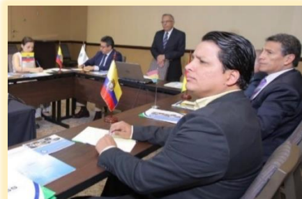
Desarrollo del Comité Regional para el Área Andina.

La Comisión Económica que es el órgano técnico encargado de la fiscalización del movimiento de fondos y la ejecución presupuestaria de la Organización, informó favorablemente al Comité Permanente de la OISS la liquidación del Presupuesto del periodo 2015-2016 e informe de auditoría, así como informe de ejecución del presupuesto del periodo 2017-2018 a 30 de junio. Igualmente, recomendó al Comité Permanente aprobar la prorrogación del presupuesto 2018 hasta el próximo Comité Permanente en 2019.