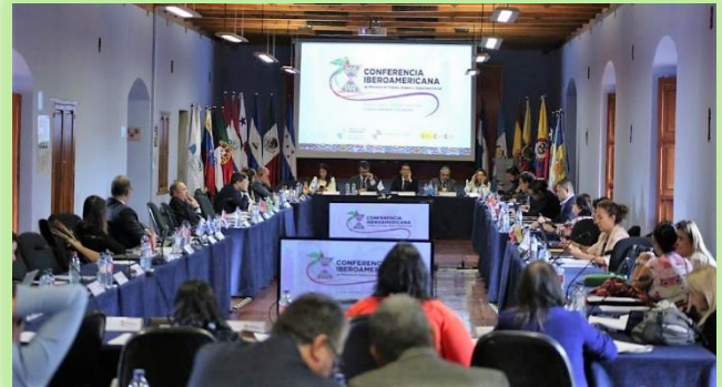
Desarrollo de la conferencia con la participación de los ministros y representantes de los países de Iberoamérica.

En La Antigua, Guatemala, el 18 y 19 de octubre se llevó a cabo la X Conferencia Iberoamericana de Ministras y Ministros de Trabajo, Empleo y Seguridad Social, bajo el lema “Empleo decente, inclusivo y sostenible”.