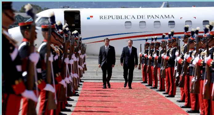
Llegada del presidente de Panamá, Juan Carlos Varela.