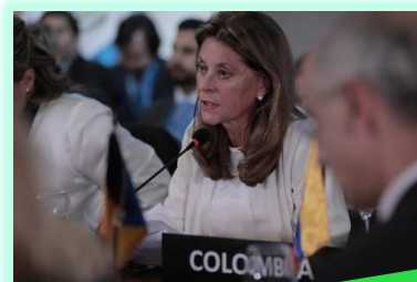
Intervención de la vicepresidenta de Colombia, Marta Lucía Ramírez