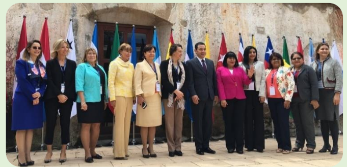
Ministras de Trabajo Empleo y Seguridad Social de países de Iberoamérica, junto con el Presidente de Guatemala y la Secretaria General de la OISS - X Conferencia Iberoamericana de Ministras y Ministros de Trabajo, Empleo Y Seguridad Social.