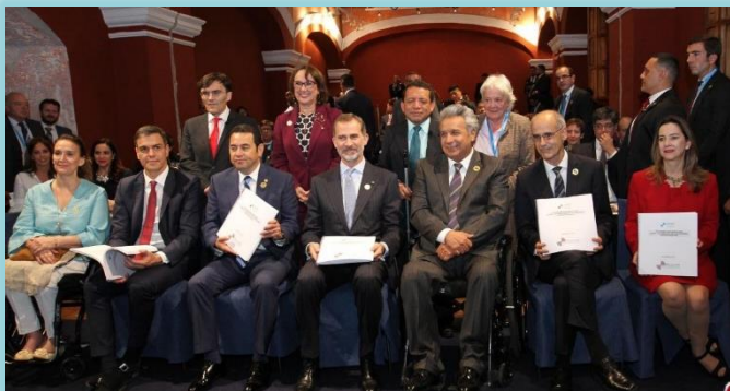
Aprobación del Programa Iberoamericano sobre Derechos de las Personas con Discapacidad.