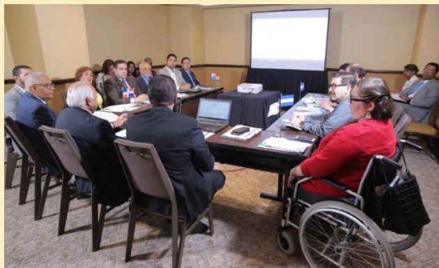
Desarrollo del Comité Regional para Centro América y el Caribe.