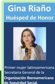
CLIC para el video del momento de la distinción.