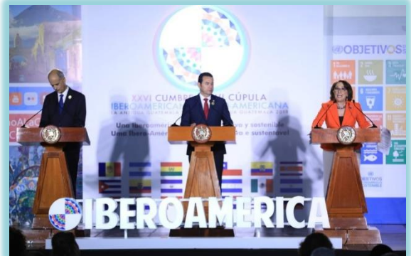
Intervención de las autoridades; presidente de Guatemala, Jimmy Morales (medio); presidente de Gobierno de Andorra, Antoni Martí y la secretaria general de la SEGIB, Rebeca Grynspan.