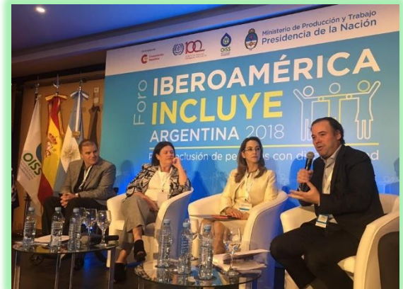
Disertaciones de invitados expertos en materia de empleo para personas con discapacidad.

El pasado 6 de diciembre, en Buenos Aires – Argentina se llevo a cabo el Foro “Iberoamerica Incluye 2018”, el encuentro fue impulsado por la Organización Iberoamericana de Seguridad Social (OISS) para promover el empleo de las personas con discapacidad. Contó con el apoyo del Ministerio de Producción y Trabajo y de la Cooperación Española.