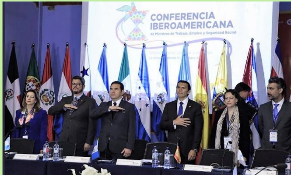
Inicio de la conferencia; mesa principal con presencia de autoridades, entre ellos el presidente de Guatemala y la secretaria general de la OISS.