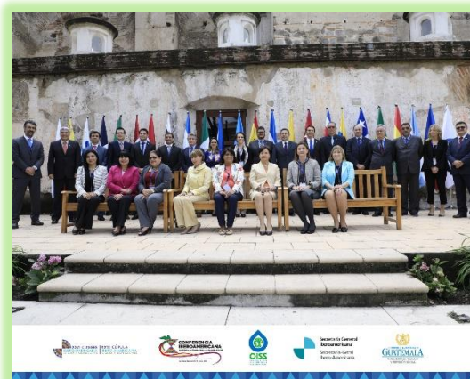
Foto oficial de la X Conferencia Iberoamericana de Ministras y Ministros de Trabajo, Empleo y Seguridad Social.

INGRESA AQUÍ PARA VER LA DECLARACIÓN DE LA CONFERENCIA