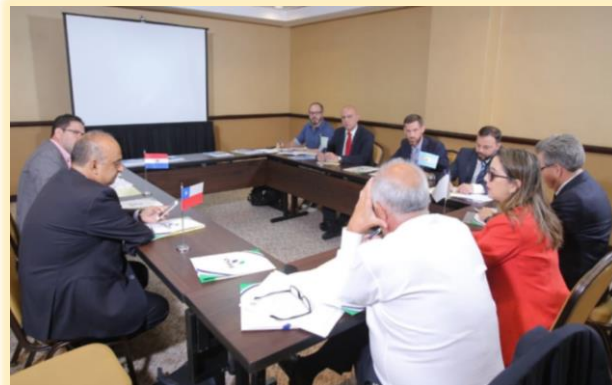
Desarrollo del Comité Regional para el Cono Sur.