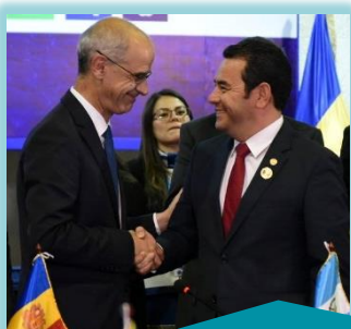
Andorra próxima sede de la Cumbre Iberoamericana

La Cumbre Iberoamericana finaliza reafirmando su compromiso con el multilateralismo y la agenda 2030.