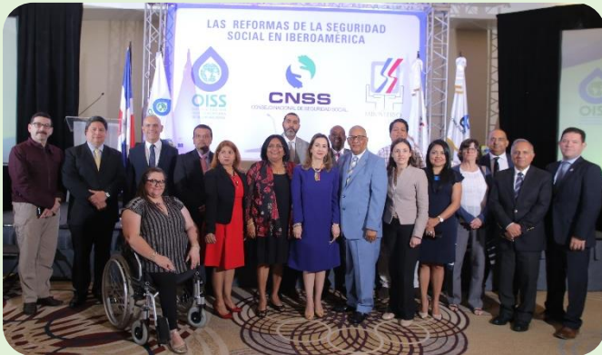
Expertos en materia de Seguridad Social de los países de Iberoamérica -Seminario internacional las "Reformas de la Seguridad Social en Iberoamérica".