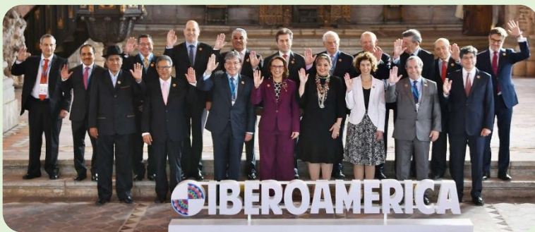
Ministros de Relaciones y Asuntos exteriores de países de Iberoamérica - XXVI Cumbre Iberoamericana de Jefes de Estado y de Gobierno.