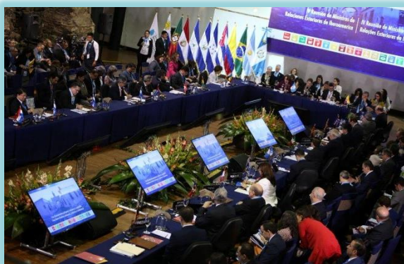
Primer día de la Cumbre

Durante su intervención la vicepresidenta de Colombia, Marta Lucía Ramírez, invito al encuentro de alto nivel que se realizará en su país en el mes de marzo, organizado conjuntamente con la OISS. Un espacio en el que se reunirán las vicepresidentas, ministras de la mujer y todos aquellos hombres que tienen a su cargo entidades o ministerios y que manejan los temas de igualdad de género en Iberoamérica.