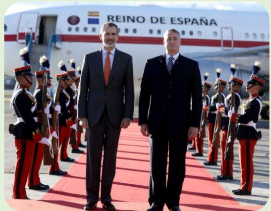
Llegada del Jefe de Estado de España, el Rey Felipe VI - XXVI Cumbre Iberoamericana de Jefes de Estado y de Gobierno.