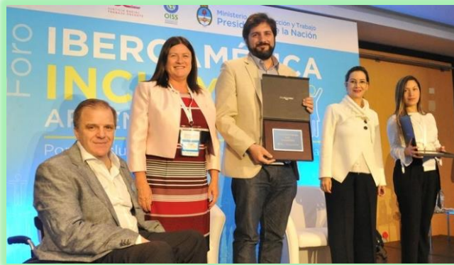
Entrega de los premios Iberoamérica Incluye 2017 a la empresa Securitas Colombia, Argentina Incluye a SAP Argentina.