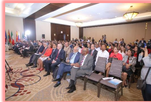
Asistentes al seminario.

El pasado 29 de noviembre se realizó en Santo Domingo, República Dominicana, el Seminario internacional las “Reformas de la Seguridad Social en Iberoamérica” organizado conjuntamente por el Consejo Nacional de Seguridad Social de República Dominicana y la Organización Iberoamericana de Seguridad Social (OISS), con el apoyo del Ministerio de Trabajo de República Dominicana.