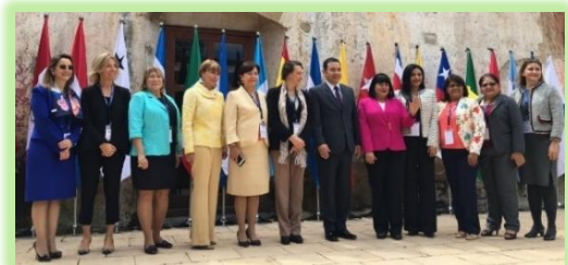
Ministras de Trabajo Empleo y Seguridad Social de países iberoamericanos junto con el presidente de Guatemala, Jimmy Morales y la secretaria general de la OISS, Gina M. Riaño B.

La segunda plenaria trató sobre las relaciones de trabajo 4.0 en Iberoamérica y se centró en la transformación de las relaciones laborales de cara a la nueva dinámica y cómo el trabajo del futuro y las nuevas tecnologías requiere de nuevas perspectivas.