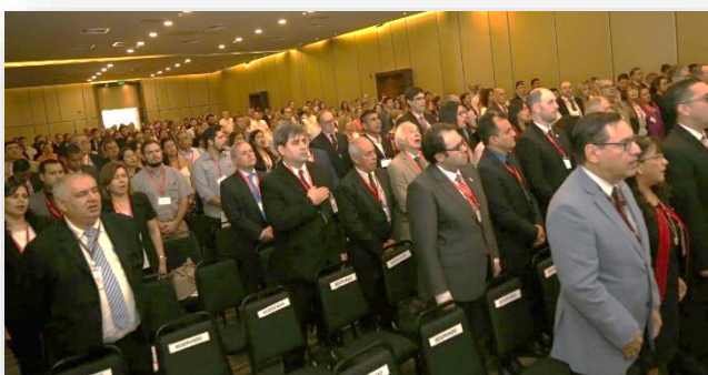
Momento de entonación del Himno de Paraguay.

Destacó asimismo el importante esfuerzo en adaptar los sistemas de protección social a las nuevas realidades del mundo del trabajo.