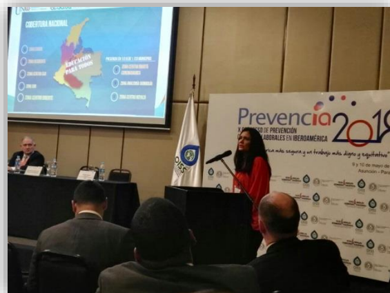
Participación de ponentes.

“Lo que se busca a través de las estrategias son objetivos muy específicos, pero lo principal disminuir la accidentalidad laboral, mejorar la calidad de vida de los trabajadores, buscar la formalización del empleo, porque en América Latina tenemos un grave problema de informalidad laboral. Buscamos también promover el dialogo social y en eso tenemos mucho que aprender de Paraguay, porque el Ministerio de Trabajo, Empleo y Seguridad Social, hemos sido testigos de ello, abrió sus puertas para el dialogo, a fin de sentarnos y acordar los temas de importancia, las normas y las leyes que pueden dirigir la Política Pública de Seguridad Social. El ministro Guillermo Sosa es un referente en la Región, porque mantener la paz social y laboral, no es fácil en nuestro medio. Quiero hacer este reconocimiento ministro, por su gran voluntad política, porque ni bien le comunicamos el interés de poder realizar este congreso, inmediatamente nos acogió la idea de poderlo hacer en este querido país, en la apreciada ciudad de Asunción. Para nosotros esto es motivo de gran satisfacción”, destacó la secretaria de OISS.