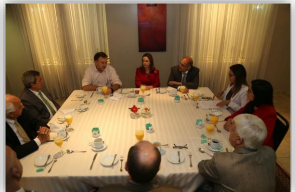
Reunión de trabajo