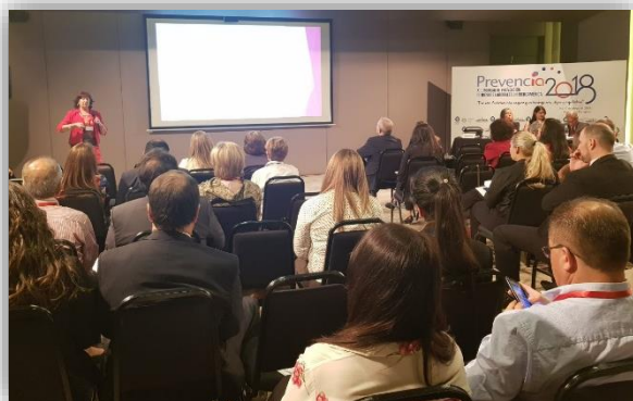
Desarrollo de los foros especializados

Aforo lleno: Más de 450 profesionales del Área de Seguridad y Salud en el Trabajo