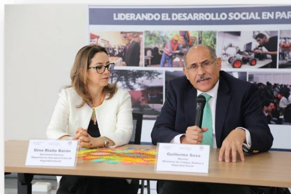
Palabras de Guillermo Sosa, Ministro de Trabajo de Paraguay.