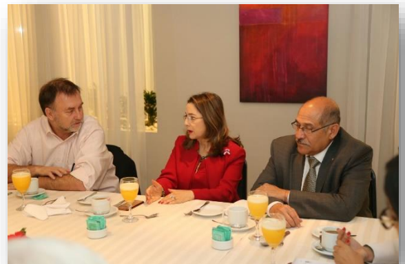
Palabras de la Secretaria general