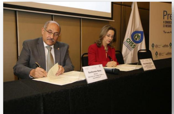
Momento de la firma del acuerdo.

El acuerdo pactado es entre la Organización Iberoamericana de Seguridad Social – OISS y el Ministerio de Trabajo, Empleo y Seguridad Social de Paraguay.