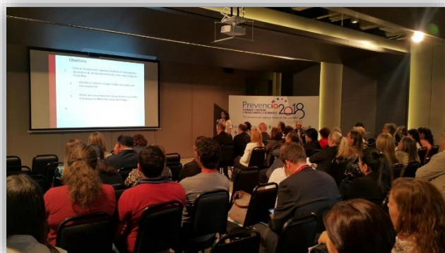
Desarrollo de la 2da jornada de PREVENCIA