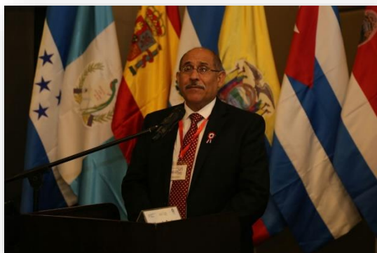
Guillermo Sosa, Ministro de Trabajo de Paraguay.