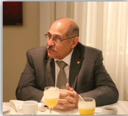
Guillermo Sosa, Ministro de Trabajo de Paraguay