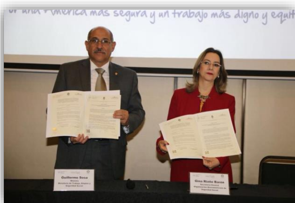
Formalización del acuerdo