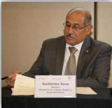
Firma del Ministro de Trabajo de Paraguay