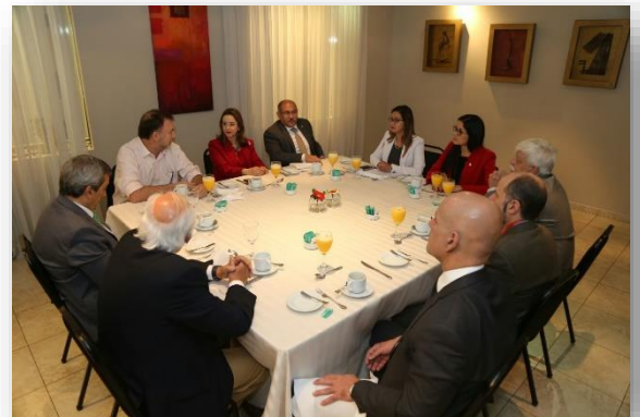
Mesa de Reunión