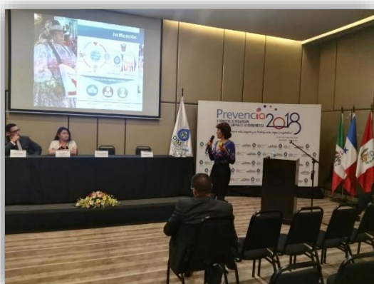
Desarrollo de las sesiones plenarias.