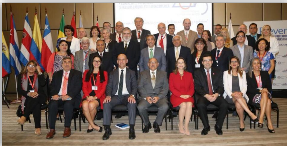
Fotografía oficial de PREVENIA 2018

Secretaria General de la Organización Iberoamericana de Seguridad Social