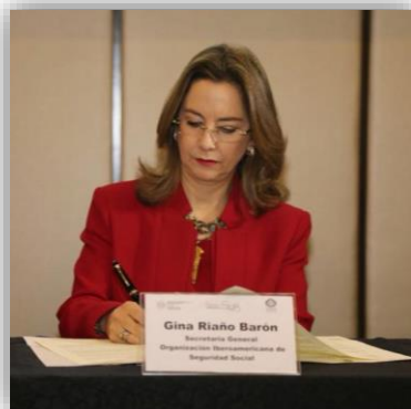
Firma de la Secretaria general de la OISS