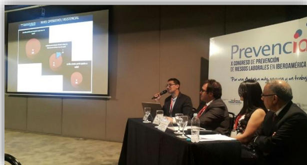
Participación de los ponentes

El Congreso contó con la asistencia de más de 450 profesionales de seguridad y salud en el trabajo, con la intervención de al menos 60 ponentes entre las sesiones plenarias y los foros especializados. La temática giró en torno a seguridad y salud en el trabajo, la prevención, las mejoras del registro de accidentalidad, la disminución de los accidentes, etc.