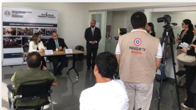
Rueda de prensa previo al día de inicio del PREVENIA