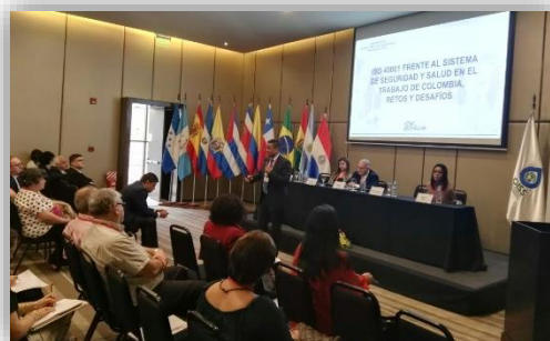
Exposición de ponentes internacionales

Los islandeses de pronto a raíz de la crisis se vieron con panorama muy distinto pero supieron enfrentarlo y superarlo gracias a que la sociedad tenia bien en claro así como sus políticos representantes en el poder que el país estaba orientado hacia el bienestar social y no hacia el bienestar de pocos, de una "élite". Así es como los islandeses enviaron un claro mensaje de soberanía nacional al mundo de las finanzas que se recuerda como " En Islandia rescatamos al pueblo y encarcelamos a los banqueros" como receta para superar la crisis y a los que la ocasionaron.