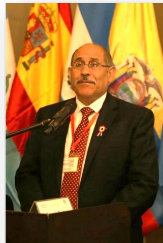
Guillermo Sosa, Ministro de Trabajo de Paraguay.

“Debemos de una vez por todas asumir como un reto nacional el brindar al trabajador los beneficios de la prevención de los riesgos laborales”,