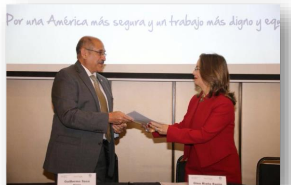
Intercambio de documentos entre autoridades