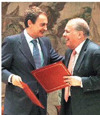
El Presidente del gobierno español, José Luís Rodríguez Zapátero junto al Secretario General de la SEGIB, D. Enrique Iglesias.

El pasado día 30 de septiembre el recién designado Secretario General de la SEGIB, D. Enrique Iglesias, firmó en La Moncloa con el Presidente del gobierno español, José Luís Rodríguez Zapátero el Convenio de Sede, Privilegios e Inmunities para esta Secretaría permanente, que será la encargada de impulsar el desarrollo de los trabajos de las Cumbres Iberoamericanas de Jefes de Estado y de Gobierno, así como coordinar las acciones que se deriven de los mandatos emitidos por dichas Cumbres.