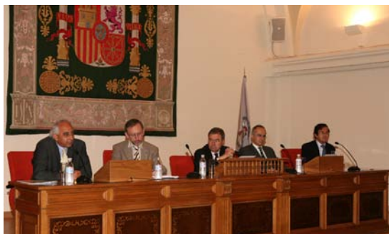
Clausura del VII Master en Dirección y Gestión de Bienestar Social y Servicios Sociales

Durante los días 5 a 23 de mayo se ha celebrado, en la sede de la Secretaría General de la OISS, la Fase Presencial del Master en Dirección y Gestión de Bienestar Social y Servicios Sociales