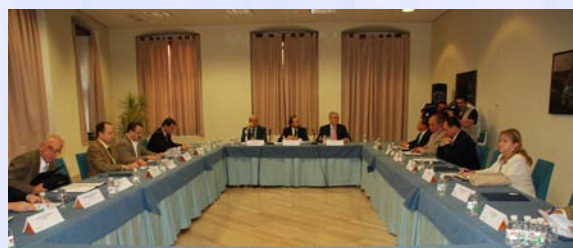
Ministros, Viceministros y Máximos Responsables Iberoamericanos de Seguridad y Salud en el Trabajo, reunidos en el Seno de la II Edición de Prevencia, celebrada en Cádiz (España) en 2007

en la materia, y en el que se recojan líneas de trabajo posibilistas y coherentes con la singularidad de la Región.