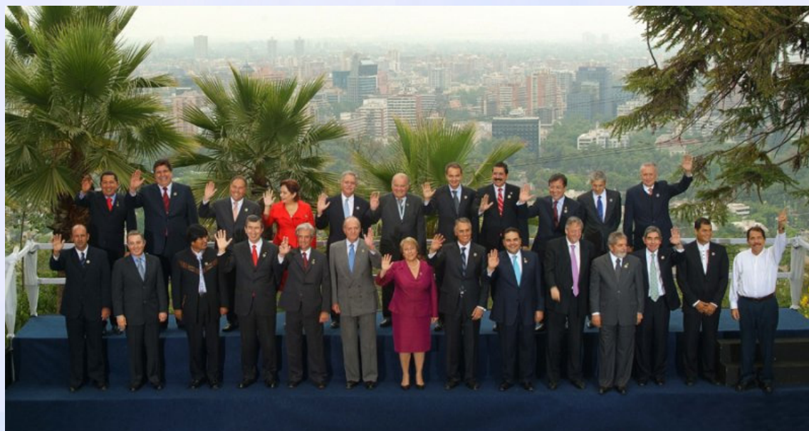
Foto Oficial de la XVII Cumbre Iberoamericana de Jefes de Estado y de Gobierno.

De esta forma el Convenio Multilateral se constituirá en un instrumento que protege a los derechos sociales de los trabajadores migrantes y sus familias, contribuyendo a la creación de una conciencia ciudadana iberoamericana que vela por el mantenimiento de sus derechos en este ámbito de la Seguridad Social, y con el que se podrán beneficiar hasta cinco millones de trabajadores iberoamericanos que laboran fuera de sus países de origen.