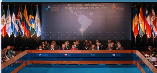
Salón plenario de la sesión inaugural de la XVII Cumbre Iberoamericana de Jefes de Estado y de Gobierno

Adoptado el Convenio Multilateral Iberoamericano de Seguridad Social por la XVII Cumbre de Jefes de Estado y de Gobierno.