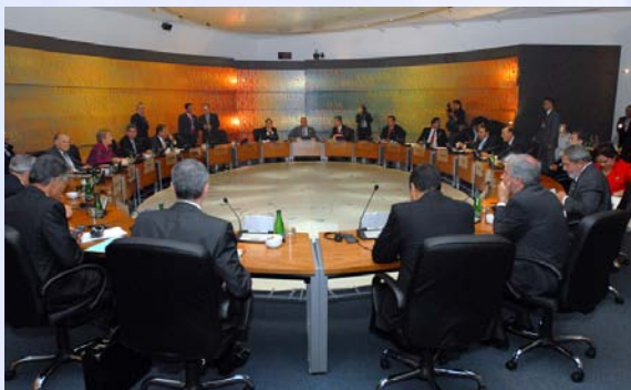
Vista general del Salón de Retiro de los Jefes de Estado Iberoamericanos

migrantes puedan gozar, en sus países de origen, de los beneficios generados con su trabajo en los países receptores”.