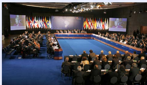
Salón plenario de la sesión inaugural de la XVII Cumbre Iberoamericana de Jefes de Estado y de Gobierno

Asimismo el Programa de Acción derivado de la citada Cumbre, en su Punto 31 incluyó: “Acordar la puesta en marcha de la Iniciativa de Cooperación Iberoamericana “Implantación y Desarrollo del Convenio Iberoamericano de Seguridad Social (IDCISS)”, gestionada por la SEGIB y la OISS, para permitir la pronta entrada en vigencia de dicho Convenio Multilateral así como, la promoción y coordinación de la negociación de su Acuerdo de Aplicación”.