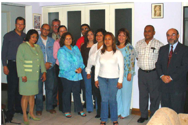
Grupo del Curso Salud Ocupacional y Calidad Total

Este 15 de agosto finalizó exitosamente la III edición del Curso Regular Cuatrimestral Salud Ocupacional y Calidad Total que realiza el Centro Regional anualmente, habiendo participado funcionarios y funcionarias de cinco instituciones; Poder Judicial, Caja Costarricense de Seguro Social (CCSS), Instituto Nacional de Aprendizaje (INA), Junta de Protección Social de San José (PSSJ) y Consejo de Salud Ocupacional (CSO).