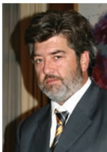
D. Yerko Ljubetic Godoy, Ministro de Trabajo y Previsión Social de Chile