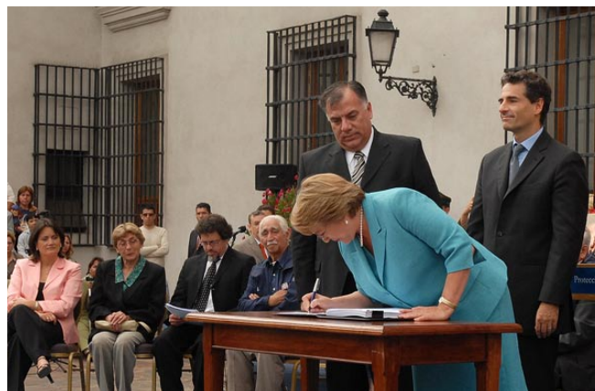
La Presidenta de la República, D a . Michelle Bachelet firma el proyecto de ley sobre Reforma Previsional

10. Más transparencia (garantizar la disciplina y transparencia fiscal).